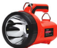
Refletor recarregável certificado Ex-ATEX, 222 lm, M-FIRE SL112