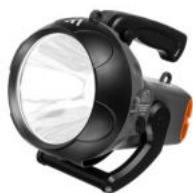
Lanterna recarregável VANGUARD PSL0031