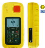
TWING ONE ATEX